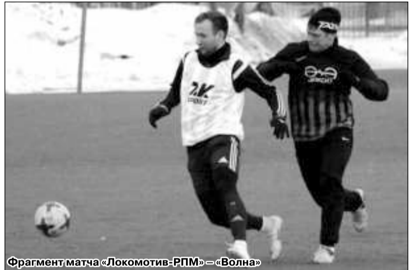
Фрагмент матча «Локомотив-РПМ» — «Волна»