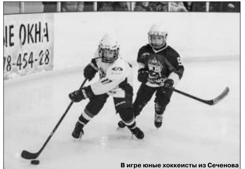
В игре юные хоккеисты из Сеченова

Когда стал главой администрации, появилось желание еще поднять уровень. В 2014 году привлекли в команду трех «легионеров» из Нижнего Новгорода. Но, честно говоря, их отношение к делу не очень понравилось, они так и не смогли найти общий