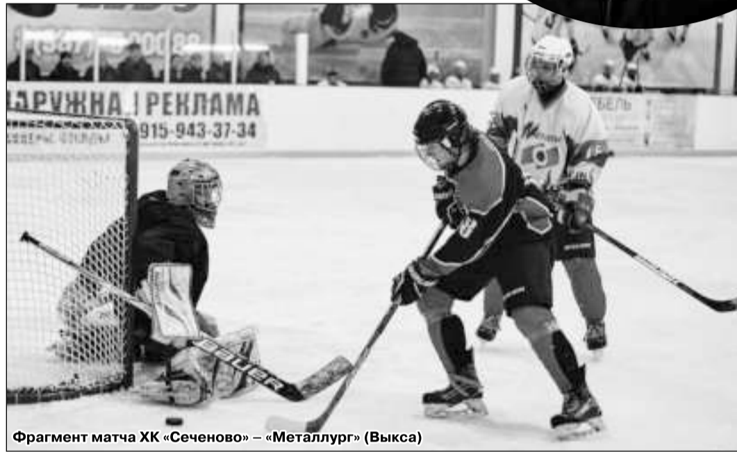
Фрагмент матча ХК «Сеченово» — «Металлург» (Выкса)