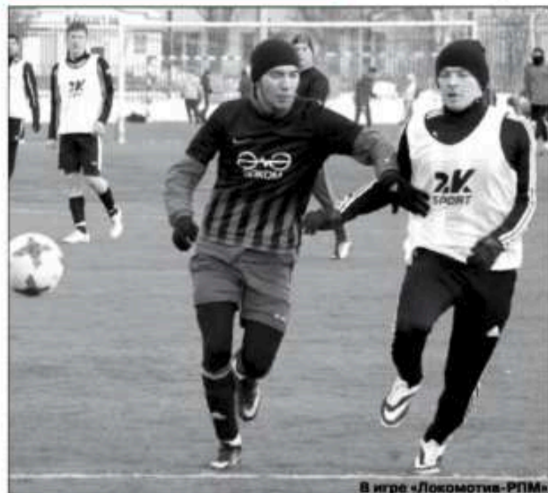
В игре «Локомотив-РПМ»